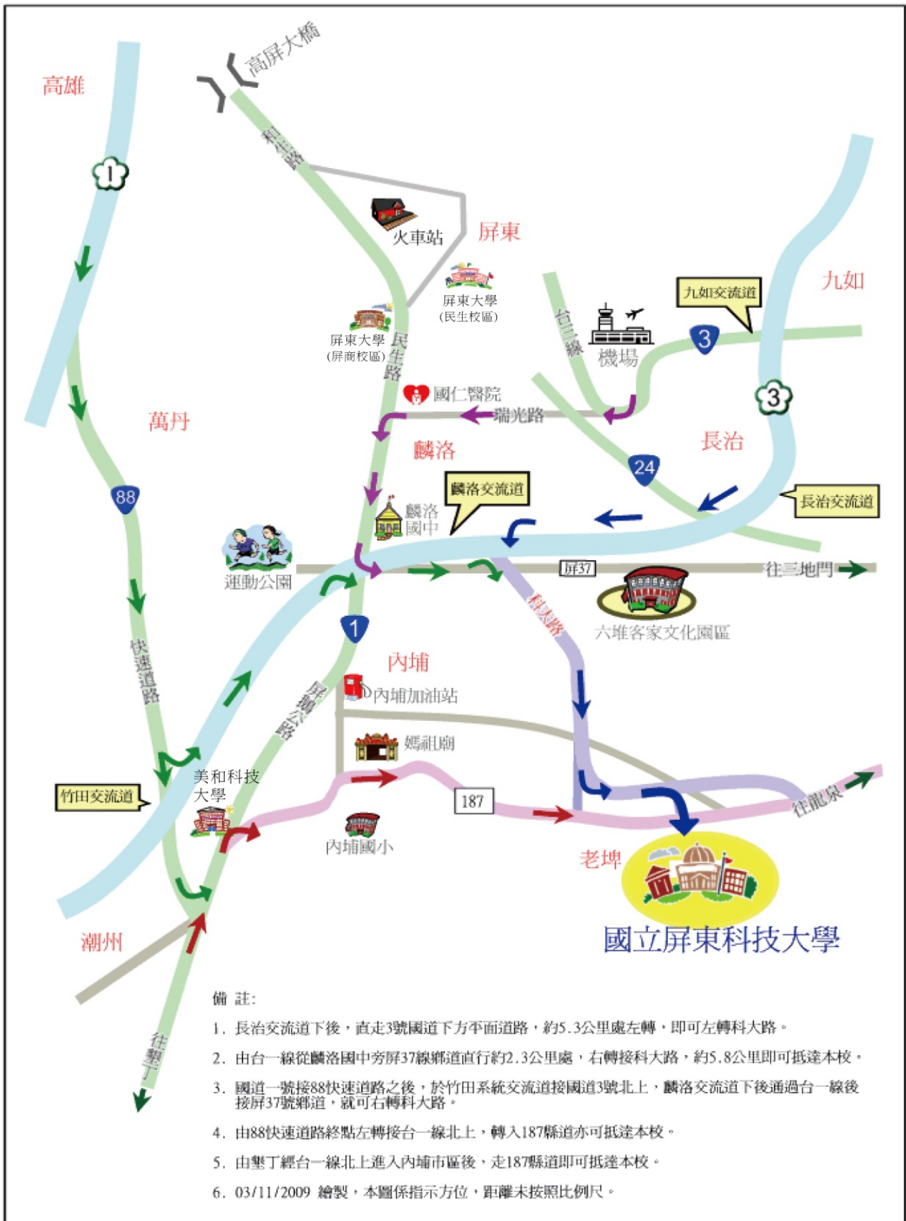
國立屏東科技大學位置示意圖